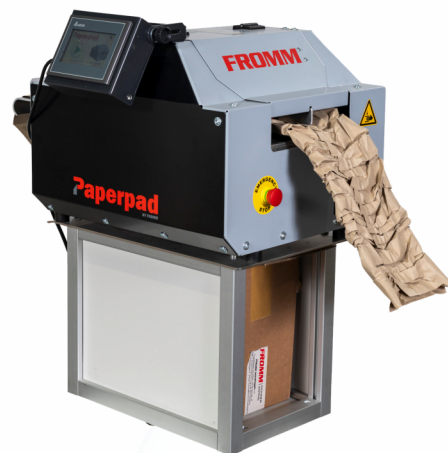
Kompaktní otočný stojan